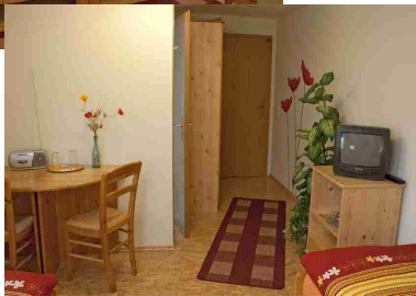
Das Doppelzimmer – gemütlich mit Dusche und Fernseher

Zwei gemütliche Dachzimmer... jedes mit Doppelbett und noch jeweils zwei einzelnen Betten. Beide liebevoll hergerichtet...ideal für Familien zum urlauben.