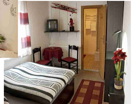
Das Einzelzimmer mit Dusche